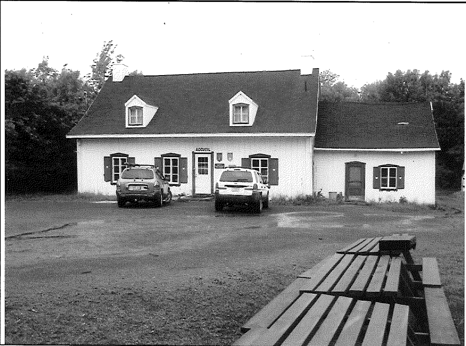
Photo numéro: 1 Identification : le bâtiment principal Photo non modifiée Photo modifiée Description des modifications

J'atteste que l'ensemble des photos originales est conservé sur le répertoire sécurisé « M :\Rég-03\Identifiant ».